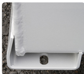
Skyddsfötter med montagefästen för flak.