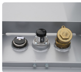
2" analog nivå-mätare, 2" tanklock, 1" övertrycks-/vakuumentil.