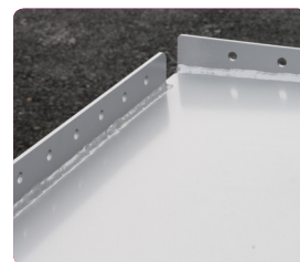
Toppsarg med montagefästen för tanknings slang respektive diesel-handtagshållare.