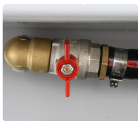
Monterad kulventil och slangnippel 3/4" matningsanslutning.