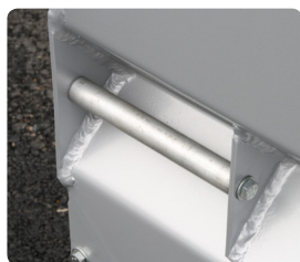
Lyft- & lastsäkrings-fästen på alla 4 sidor.